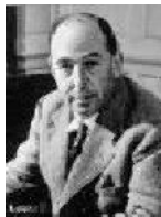
C. S. Lewis

Título Original: The Lion, the Witch and the Wardrobe .